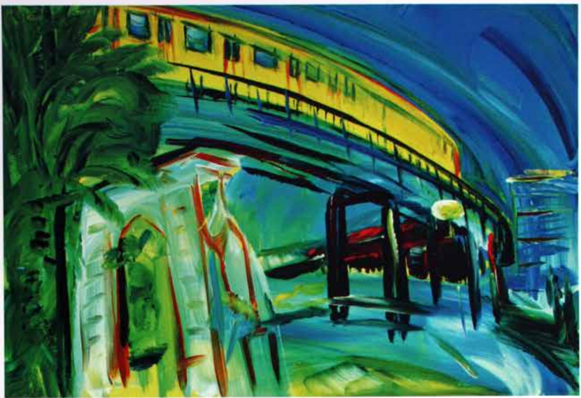
Torsten Schlüter „Kreuzberg – Friedrichshain“, 2011, Acryl, 100 x 140 cm